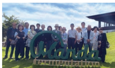
尾道・しまなみ海道